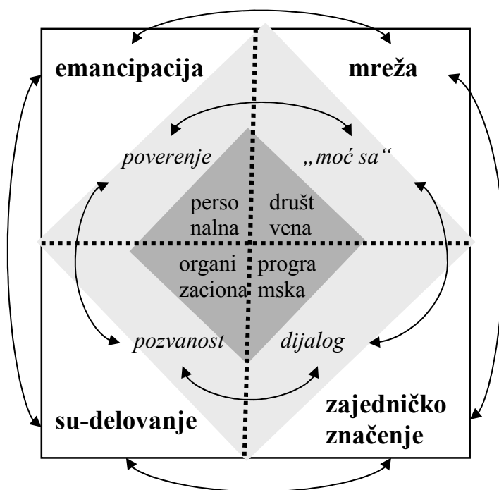
Šema 2. Dimenzije partnerskog odnosa

drugih (čime se razvija moć za i vlastito osećanje moći – samopoštovanje) i jača moć sa (Chambers, 2004).